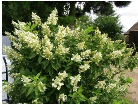
Hydrangea paniculata (pluimhortensia)