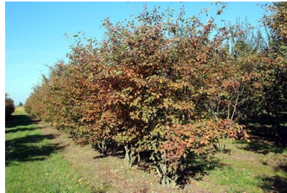
Krentenboompje (bladverkleuring naar herfst)