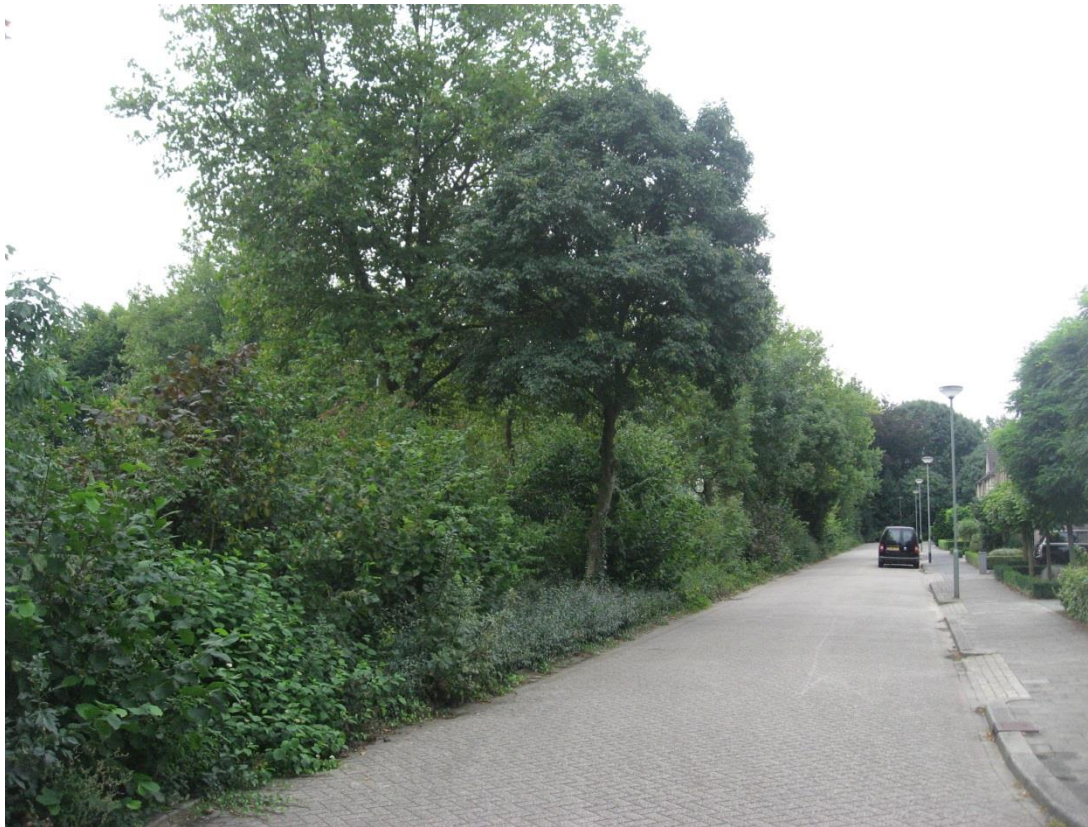
Afb. Bomen staan in concurrentie met andere bomen. Boomkronen groeien in elkaar