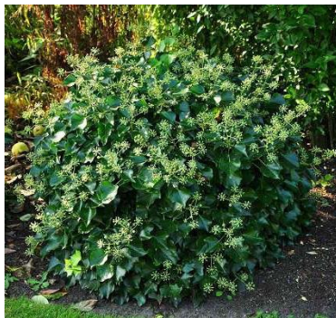
Hedera helix 'Arborescens' (struiklimop)