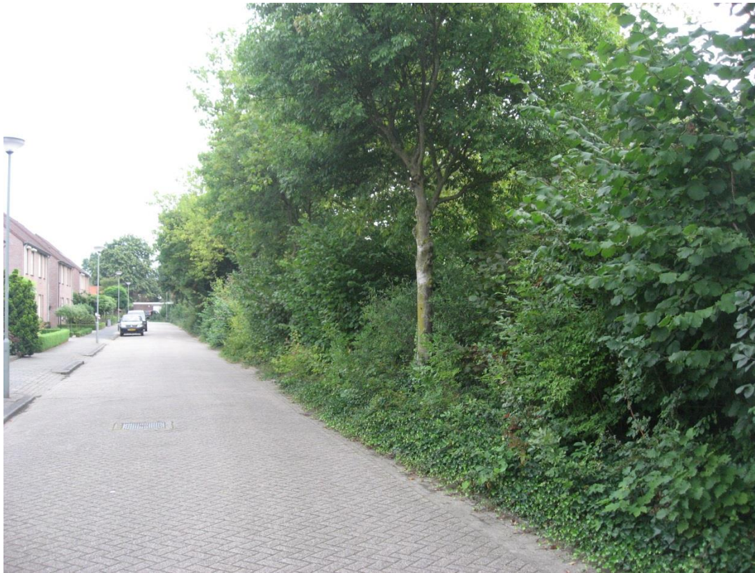
Afb. Massale groenwand tot aan de rijweg t.h.v. Zandbleek nummer 6 t/m 24