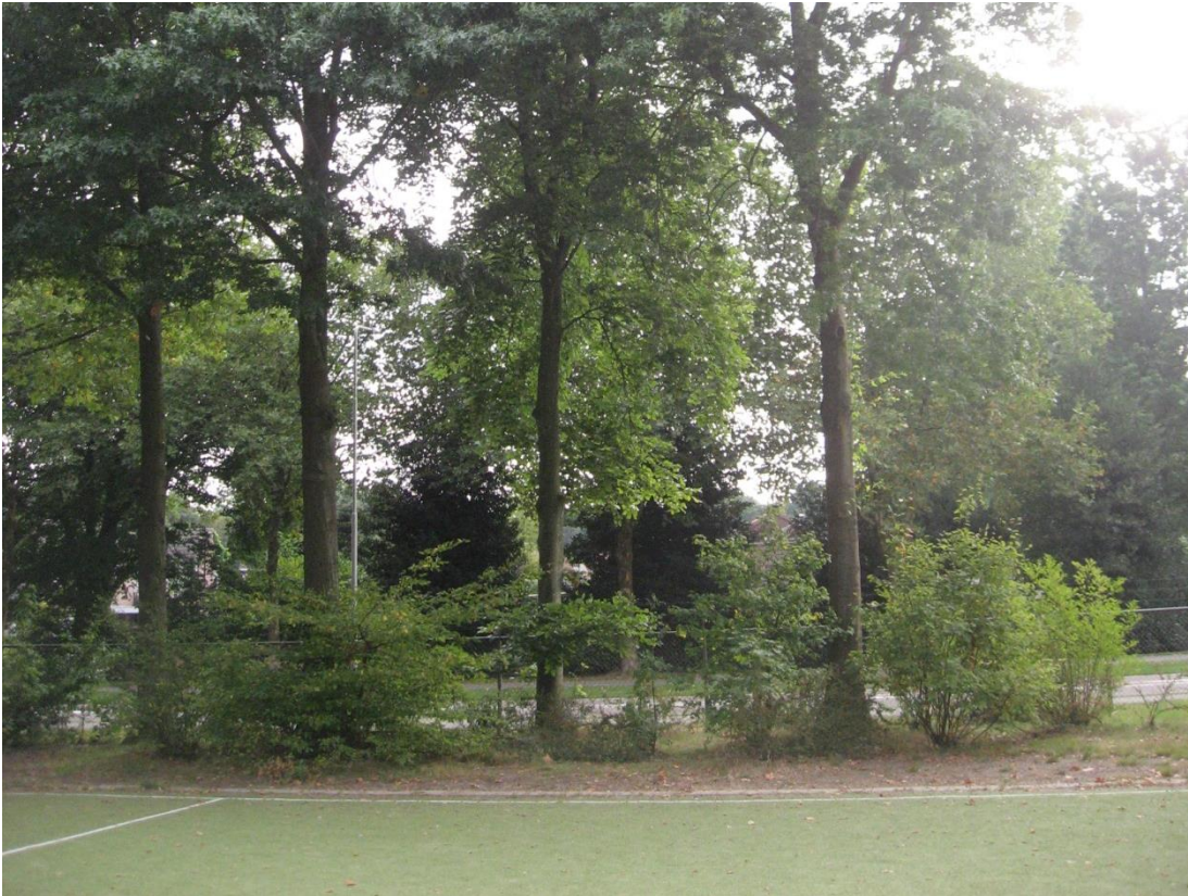
Afb. Bestaande bosschage naar de Maasheseweg is nog voor circa 50% intact