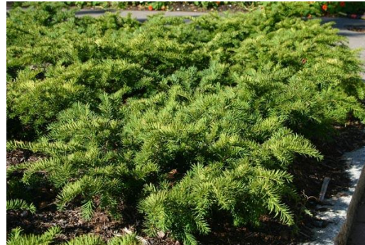
Taxus baccata 'Repandens' (Venijnboom, breedspreidend)