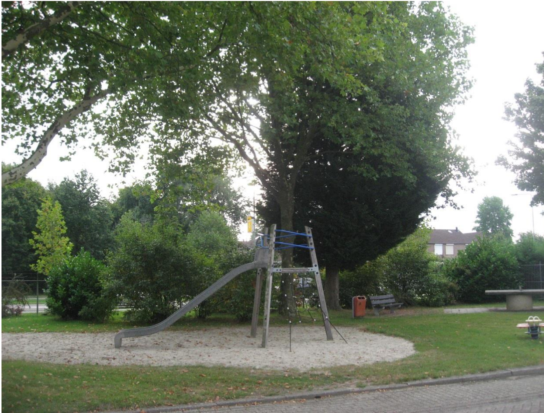
Afb. Conifeer groeit in de kroonprojectie van de Plataan