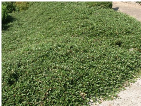
Cotoneaster dammeri 'Mooncreeper' (Dwergmispel)