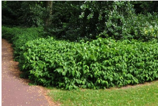
Cornus stolonifera 'Kelsey's Dwarf' (Canadese kornoelje)