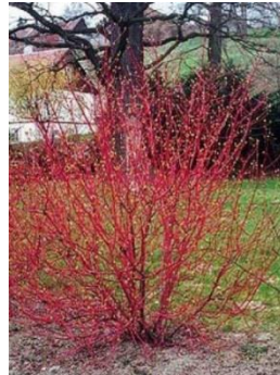
Kornoelje (Silhouette winterbeeld)