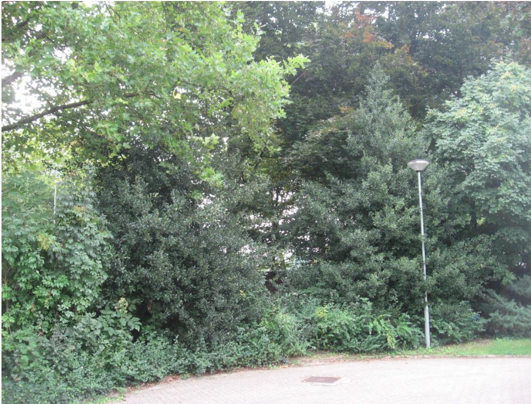
Afb. Kwaliteit in de bosschage door toepassing van hulsten (groenblijvend)